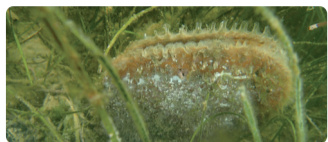
► Grande nacre (Pinna nobilis)