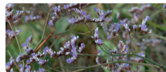
► Saladelle en fleur (Limonium narbonense)