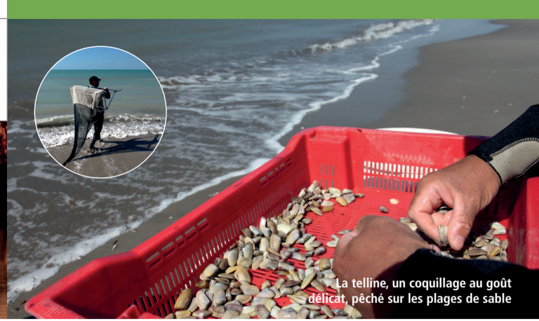
La telline, un coquillage au goût délicat, pêché sur les plages de sable.