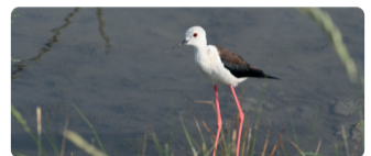
► Echasse blanche (Himantopus himantopus)