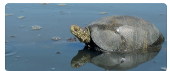
► Cistude (Emys orbicularis)