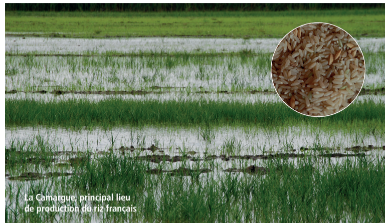
La Camargue, principal lieu de production du riz français.