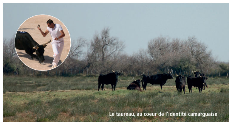
Le taureau, au cœur de l'identité camarguaise.