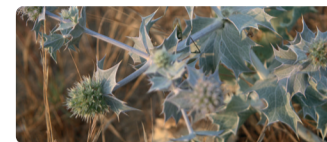
► Chardon des sables (Eryngium maritimum)