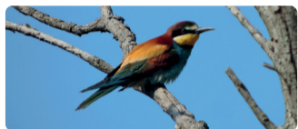
► Guépier d'Europe (Merops apiaster)