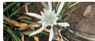
► Lis des sables (Panicum maritimum)